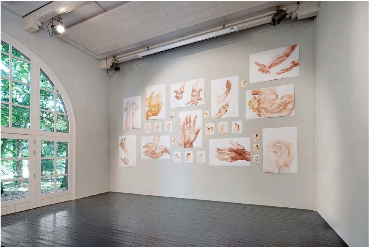
on being in*visible