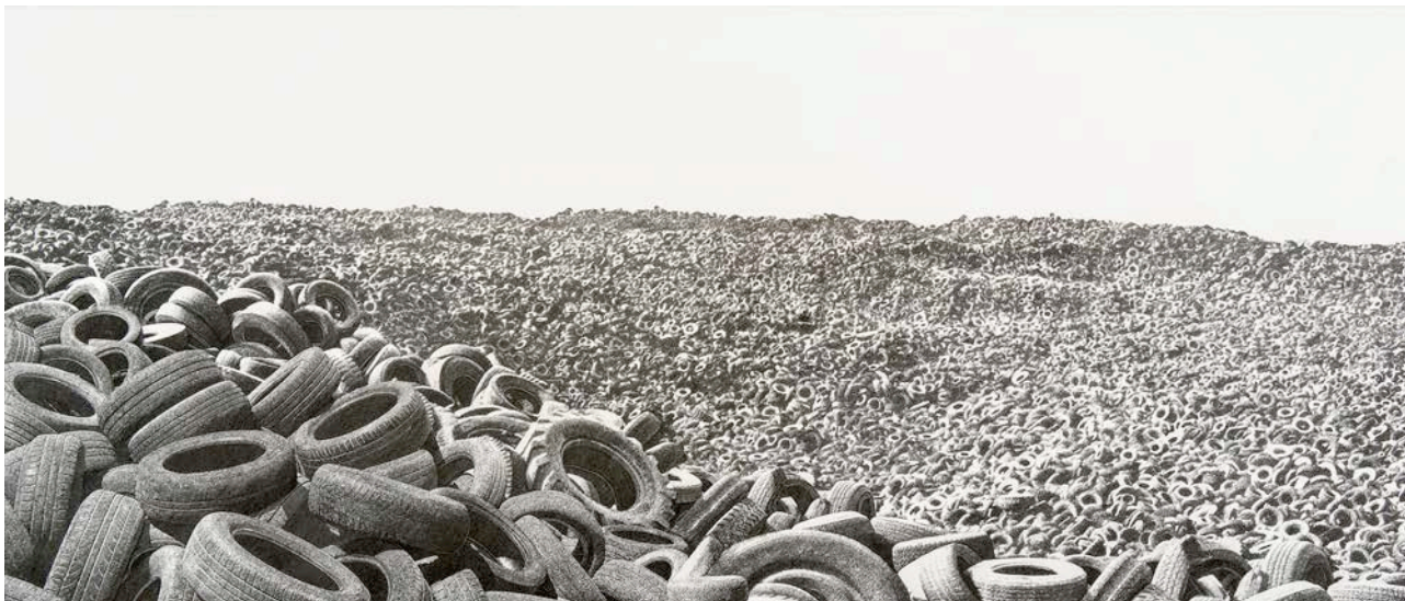
Deniz Aktaş, The Ruins of Hope I , 2019, inkt op papier, 120 × 310 cm

De tentoonstelling richt zich dus nadrukkelijk niet alleen op het Nederlandse perspectief of alleen op het verleden van WOII. Dit vormt een startpunt dat middels de geselecteerde werken en uitgenodigde kunstenaars wordt verrijkt met perspectieven uit verschillende tijden en culturen. Hieronder geven we een overzicht van de deelnemende kunstenaars 10 , daarna ook een overzicht van het publieks- en educatieprogramma.