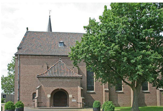
De zuidgevel met toegangsportaal