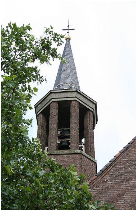
De opgehoogde trap toren met lantaarn