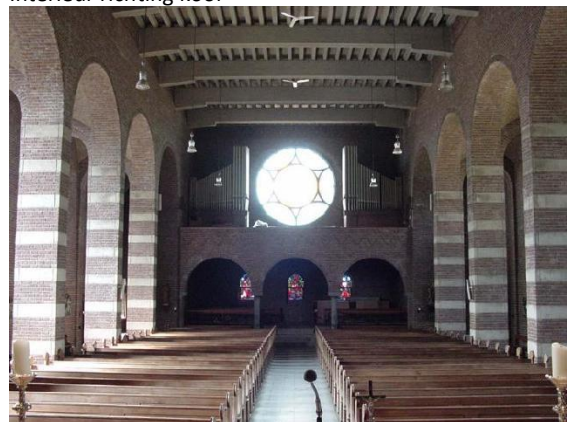
Interieur richting zangtribune