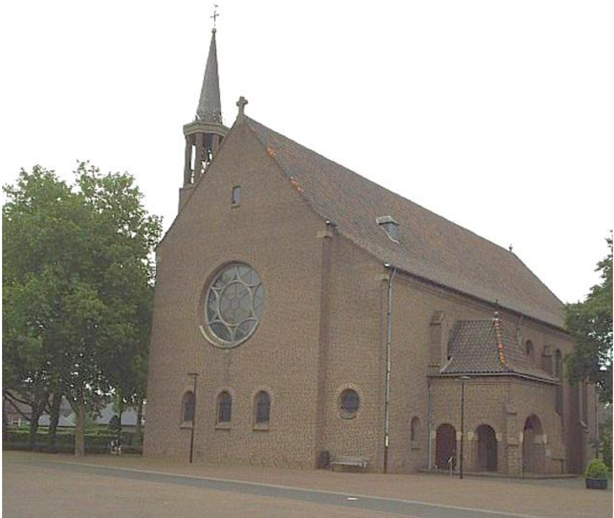
De west en zuidgevel