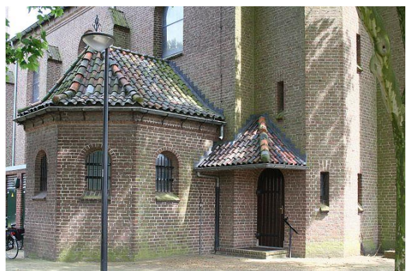
De noordgevel met doopkapel