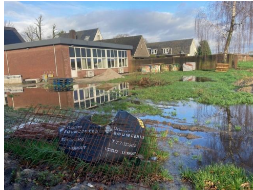
Tijdens de transformatie