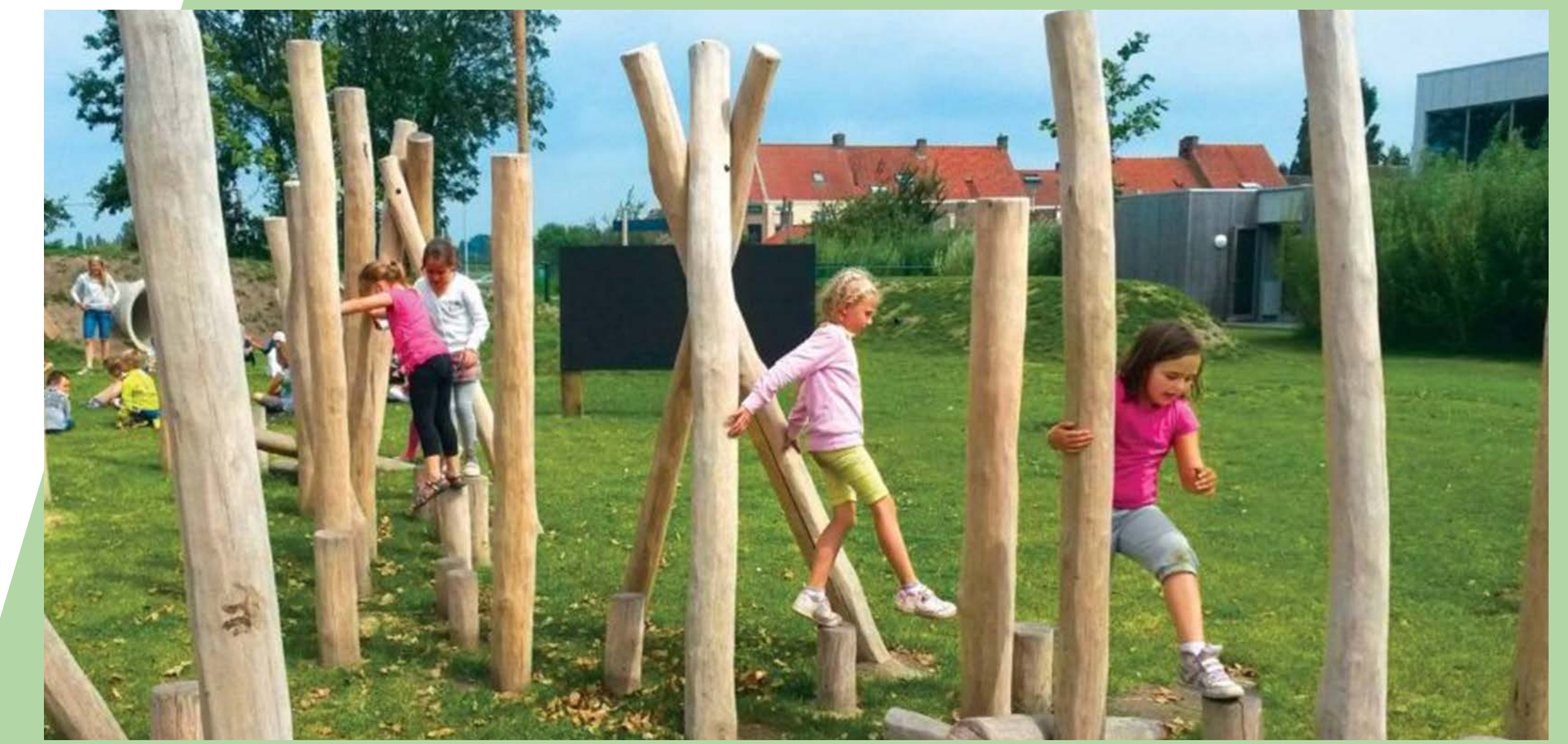
Palen en stapstammen

Een verhoogde plek met een pad erover en een cirkel van boomstammen om overheen te balanceren of een spel te spelen met "binnen de cirkel" en "buiten de cirkel".